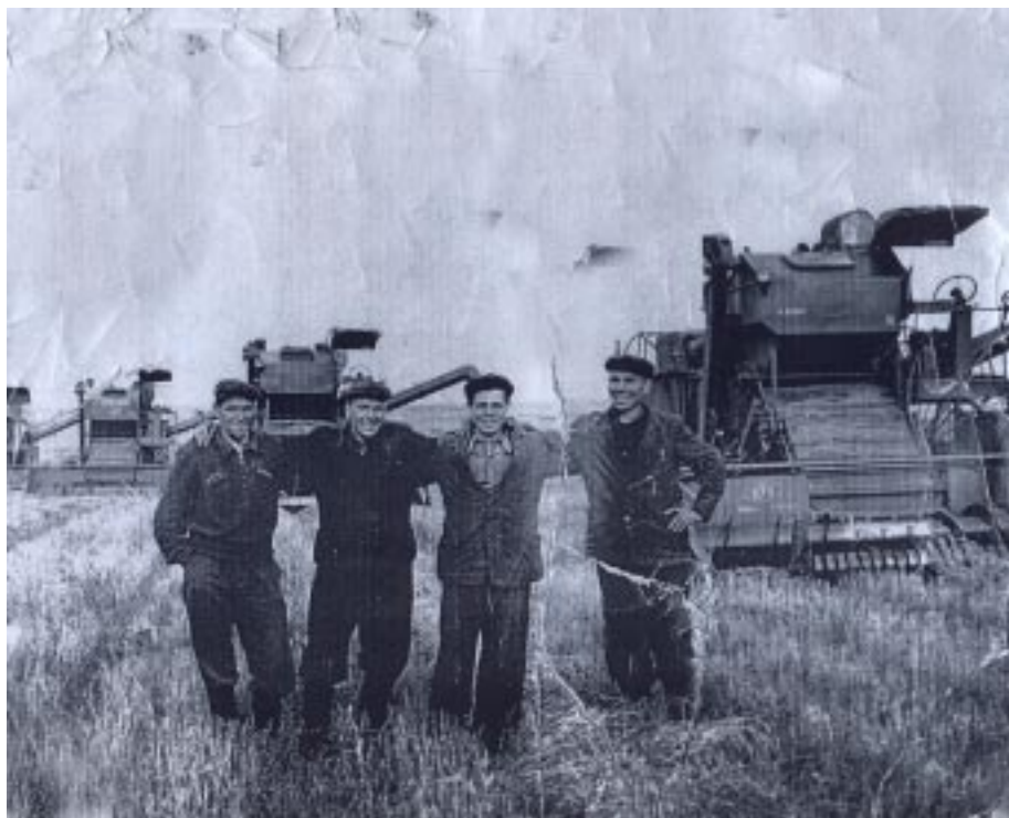
Старая фотография из семейного альбома - частичка истории

«Большой труженик, блестящий знаток агрономии, он крепко держит в своих руках все нити полеводства. Участок у него большой, только пашни на отделении – восемь тысяч гектаров, но он отлично справляется со своими обязанностями», – напишут о нём в одном из номеров районной газеты «Красный уралец».