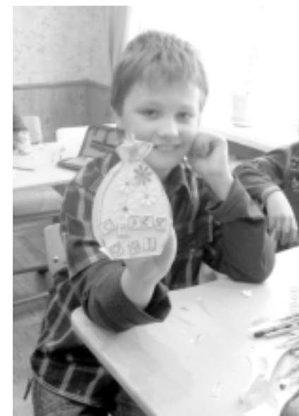
Открытка из бумаги проще всего

Можно придумать ещё много разнообразных способов изготовления открыток. Самое главное в этом творческом процессе – фантазия и искренне желание принести человеку радость.